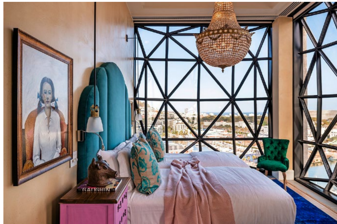
ERHABEN Vom neuen Luxushotel The Silo überblickt man das Hafenbecken Kapstadts.